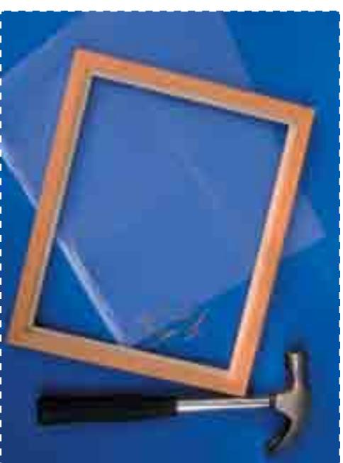
Как сделать форму