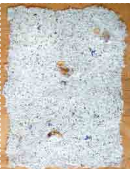
Бумага с зелёным чаем-заваркой