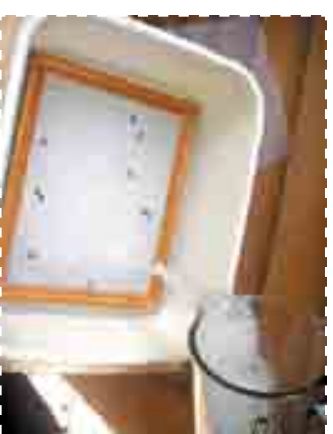
В. Поместите форму для бумаги в лоток с водой и налейте бумажную массу