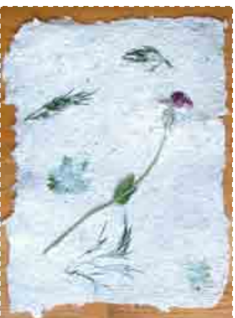
Бумага с цветами