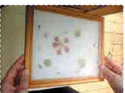
Г. Распределите украшения, выньте форму из воды и накройте ещё одной сеткой