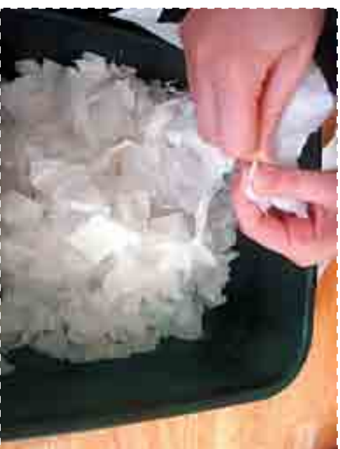
А. Разорвите бумагу на кусочки