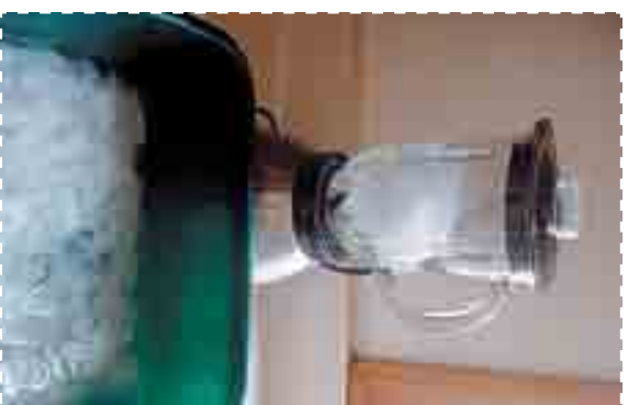
Б. Вымочите бумагу в горячей воде и размелите в блендере