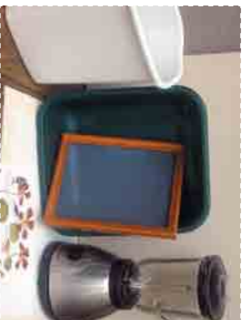
Оборудование для изготовления бумаги