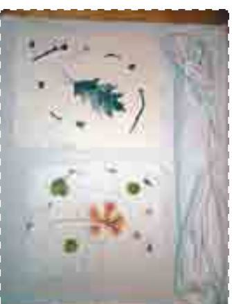
Д. Положите бумагу между полотенцами, отожмите, аккуратно снимите сетки и дайте бумаге высохнуть